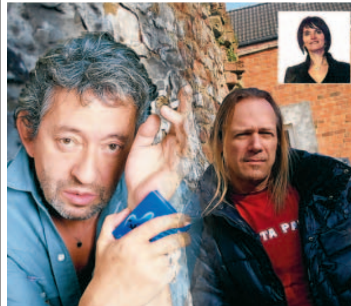
"Gainsbarre" reste immortel...